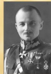
GEN. MARIAN KUKIEL 1885-1973