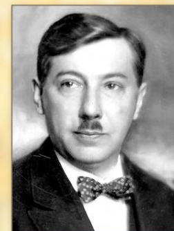
EUGENIUSZ KWIATKOWSKI 1888-1974

Wspomnienia o żołnierzach II wojny światowej